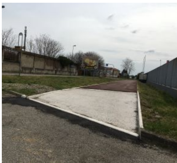
Il tribunale (a destra) doveva essere inaugurato entro fine mese, la ex Rsa (in alto) entro aprile. Qui sopra, la pista ciclabile sul Sabotino, completata solamente per un tratto. Adesso è tutto fermo