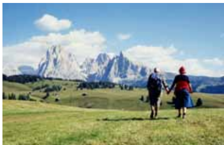
Luigi Ghirri, Alpe di Siusi , 1979