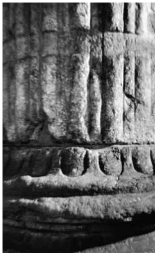
Mimmo Jodice, Anamnesi , 1998