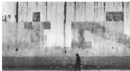
Aaron Siskind, Mexico , 1961

L'importante fondo raccoglie fotografie e documenti che rispecchiano la trentennale attività della galleria Il Diaframma di Milano, diretta da Lanfranco Colombo (Milano, 1924), "pioniere della fotografia italiana", noto organizzatore culturale, editore, gallerista. La raccolta di fotografie è assai eterogenea e comprende grandi maestri della fotografia storica e contemporanea, italiani e stranieri, giovani, professionisti, dilettanti, abbracciando ogni area della fotografia, dal reportage alla ricerca artistica, dalla moda alla pubblicità allo sport.