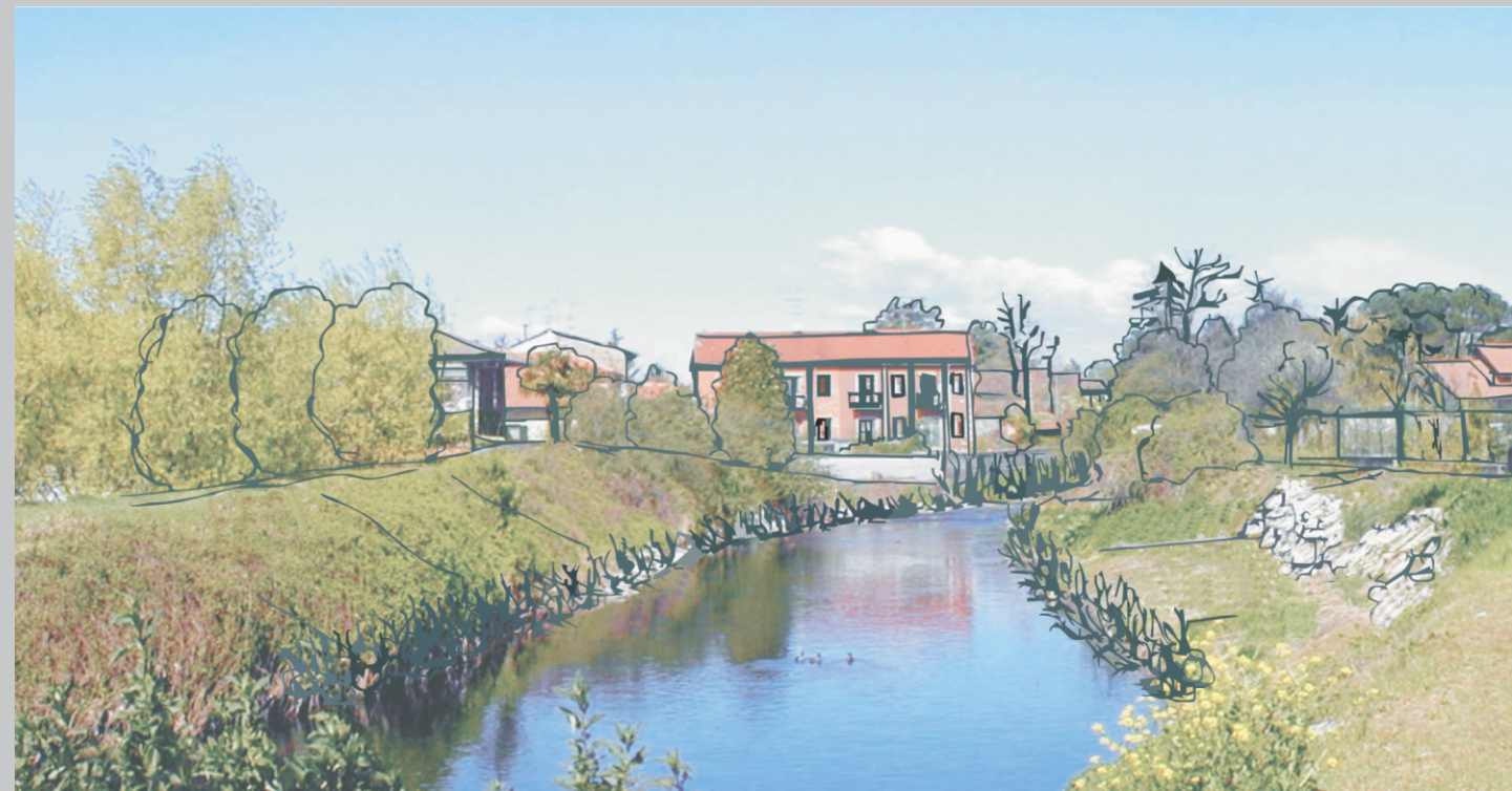
Simulazione situazione dopo l'intervento