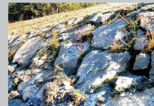
Dopo alcuni mesi