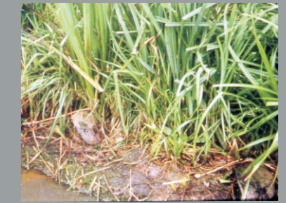
Particolari di fascinata di elofite