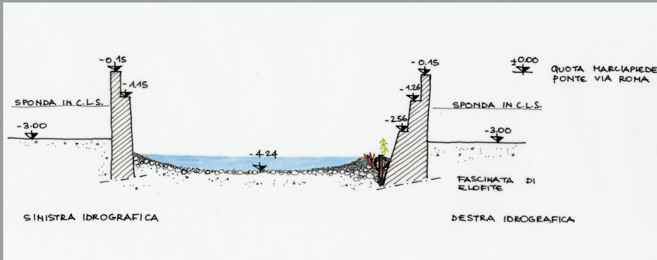
Sezione C-C Scala 1:100