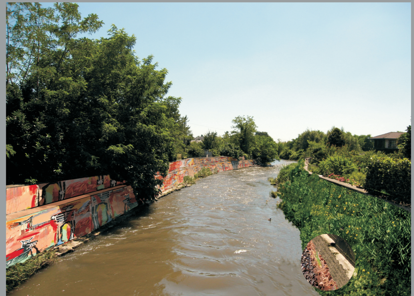
Simulazione situazione dopo l'intervento