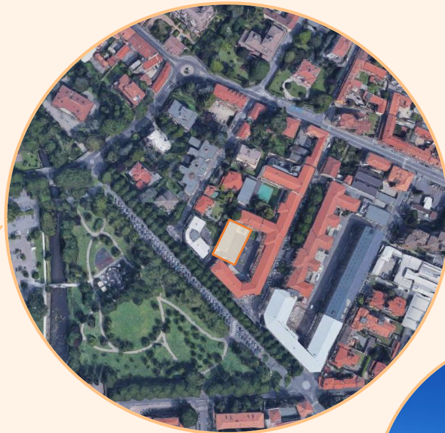
L'area oggetto d'intervento all'interno del primo cortile della scuola. La palestra, come la scuola, fu edificata tra il 1917 e il 1920