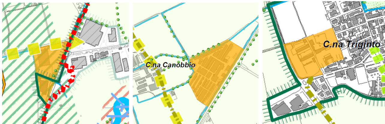
Complesso dell'ex tritovagliatore di rifiuti Ex porcilaia

Triginto . La variante al P.G.T. coglie le opportunità introdotte dalla l.r. 18/2019 in tema di rigenerazione territoriale, prevedendo tutte le possibilità che la nuova disciplina regionale propone per agevolare il recupero di questi ambiti: in tema di quantità, funzioni, onerosità, dotazioni territoriali e procedimenti. Al contempo è previsto che le trasformazioni di tali ambiti non vadano ad implementare con oneri e dotazioni urbanistiche altre parti del territorio ma concentrino tutta la loro capacità di generare risorse (contributi di costruzione, monetizzazioni, opere) nella riqualificazione del territorio agricolo circostante. Sulla base di progetti di ricostruzione del paesaggio, di miglioramento delle attività agricole, di interventi pilota per un'agricoltura sostenibile. Al fine di favorire il recupero di tali ambiti il nuovo P.G.T. dispone il ricorso alla "indifferenza funzionale", ponendo esclusivamente dei limiti in relazione alle previsioni connesse all'insediamento di medie e grandi strutture di vendita.